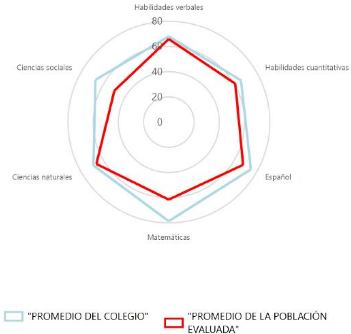
Gráfico I. Comparativo del logro del colegio con la población evaluada